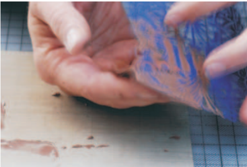
5. Vorsichtig auseinandernehmen