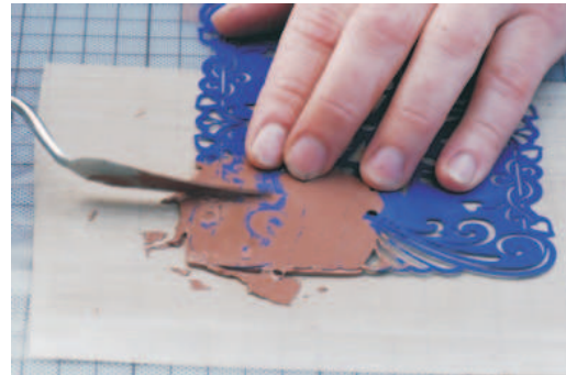
4. Überstände abnehmen