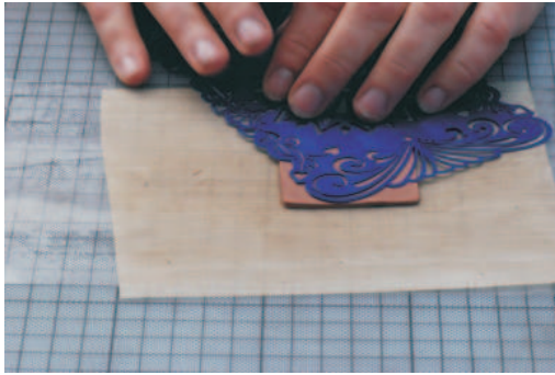
1. Schablone auf Clay auflegen