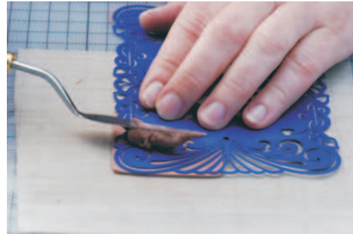
2. Paste mit Palettmesser aufbringen